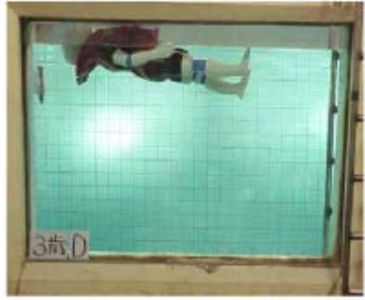
写真5 幼児ダミーによる遊泳試験の状況