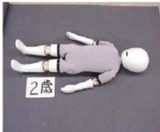
写真2 2歳幼児ダミー(水着着用)