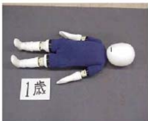
写真1 1歳幼児ダミー(水着着用)

平成15年度は、2か年事業の最終年度として、前年度の成果を踏まえ、1歳および2歳用の幼児ダミー2体を設計・試作し、幼児ダミー関節部の構造や水着着用による影響も含め、前年度に設計、試作した3歳用幼児ダミーとあわせ3種のダミーと被験者による性能試験を実施し、幼児ダミーによる試験の有効性を総合的に検証するとともに、幼児用救命胴衣の性能評価方法案を作成した。