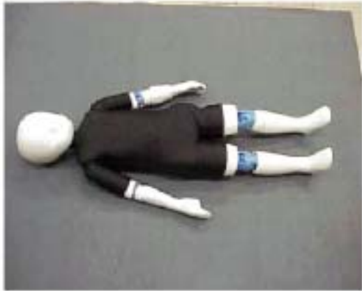
写真3 3歳幼児ダミー（水着着用）