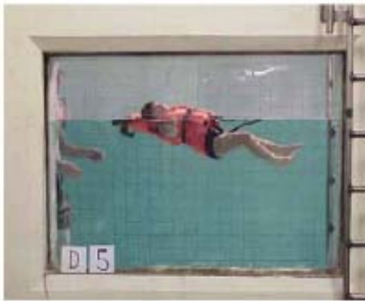
写真4 幼児被験者による遊泳試験の状況